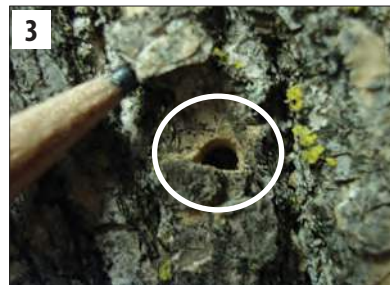
(1) Adult EAB, and actual size in top right corner; (2) EAB larva, and actual size in bottom left corner; (3) D-shaped exit hole (1) EAB adulto, y uno de tamaño real en la esquina derecha superior; (2) Una larva de EAB, y una larva de tamaño real en la esquina inferior izquierda; (3) Orificio de salida en forma de "D"

El barrenador verde esmeralda del fresno (EAB) es una especie invasora de Asia. Fue descubierto por primera vez en los Estados Unidos en el 2002. Actualmente se ha propagado en los estados del este de EUA y hasta Colorado en el oeste matando cientos de millones de fresnos. El EAB se propaga principalmente cuando es transportado en plántulas de vivero y leña. Se ha encontrado en Oregon, y todos los fresnos de las ciudades y bosques de Oregon están en peligro. Una vez que el EAB se establece, es muy difícil de controlar. Si está atento y al cuidado del EAB, usted nos puede ayudar a proteger los árboles y bosques en Oregon.